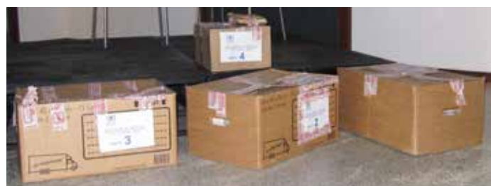
▲ Les cartons contenant les archives.