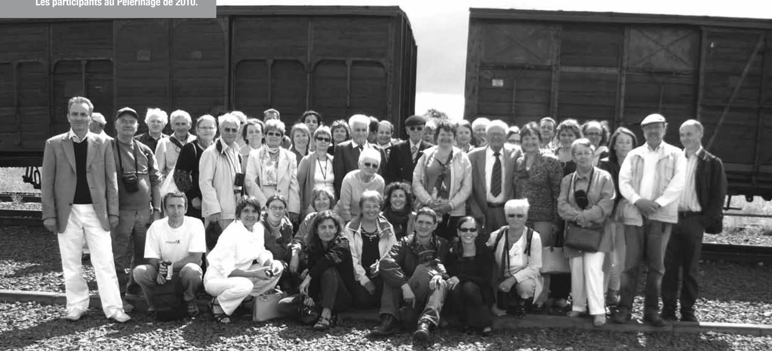
Les participants au Pèlerinage de 2010.

“ À la mémoire de mon oncle, des Tatoués qui ne sont pas rentrés, je dépose mon humble bouquet de fleurs des champs.”