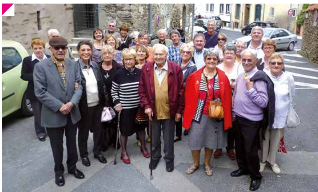
▲ La "troupe" à Collioure pour la journée de l'amitié et du souvenir.